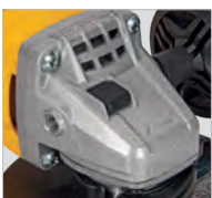
Boîte de vitesses métallique