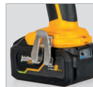
Crochet de ceinture réversible