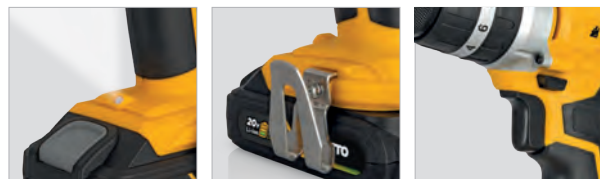
Voyant lumineux LED d'éclairage