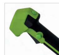
Inverseur du sens de rotation