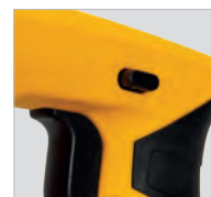
Bouton de sécurité