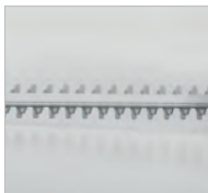
Coupe facile et efficace