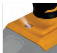
Voyant lumineux LED d'éclairage