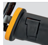
Changement rapide de lame