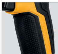
Poignée en caoutchouc antidérapante