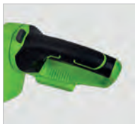
Poignée rotative et ergonomique