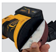
Fixation des feuilles abrasives à velcro