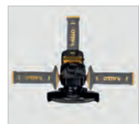
Poignée auxiliaire de 3 positions