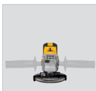
Poignée auxiliaire de 2 positions