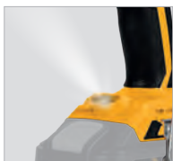
Voyant lumineux LED d'éclairage