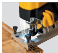
Voyant lumineux LED d'éclairage