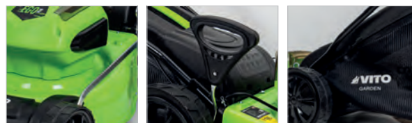
Corps en métal