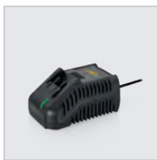
Chargeur rapide de batterie