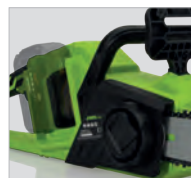
Lever de frein de chaîne