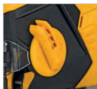
Régulateur du mouvement pendulaire