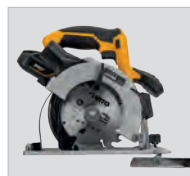
Profondeur et inclinaison de la coupe réglables