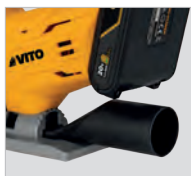
Adaptateur pour aspiration de copeaux et poussières