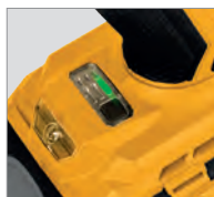
Voyant lumineux LED