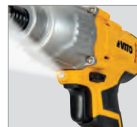
Voyant lumineux LED d'éclairage