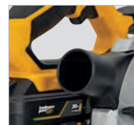
Adaptateur pour aspiration de copeaux et poussières