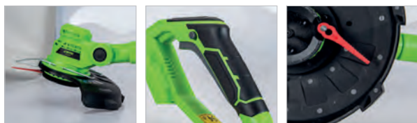
Poignée rotative à 90°