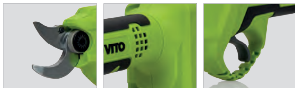
Ouverture maximale 30 mm Poignée ergonomique