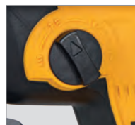
Sélecteur du mode de fonctionnement