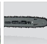
Chaîne et guide-chaîne Oregon