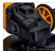
Boîte de vitesses en métal laqué noir